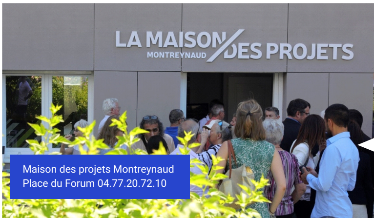
Maison des projets Montreynaud Place du Forum 04.77.20.72.10

La démolition du Clos Foujols a libéré un espace conséquent, et son devenir reste à définir. Le contenu du projet Molina, dont la concrétisation est prévue en 2023, sera alimenté, précisé et amélioré, par les avis et suggestions des habitants dans le cadre de la concertation.