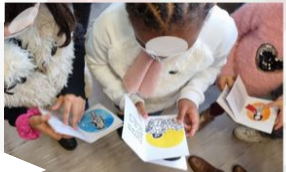
Fanzines de ce2