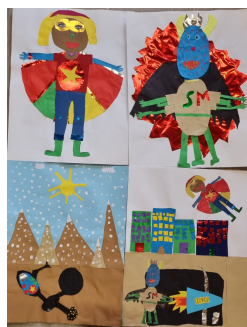
Une histoire de ce1